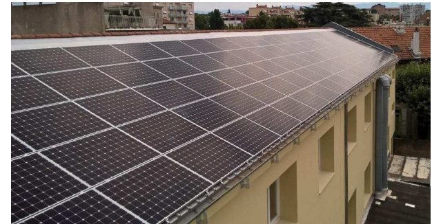
Lycée Amblard (26) -129 kWc