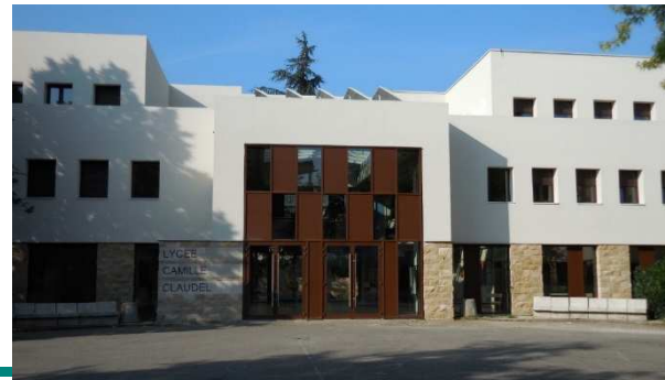
Lycée Camille Claudel Lyon