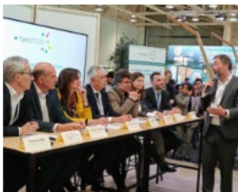
Signature de l'accord de consortium TerriSTORY® lors des Assises de la transition énergétique, à Bordeaux, le 29 janvier 2020, en présence d'Arnaud Leroy, président de l'ADEME

TerriSTORY® est un projet porté par une communauté ouverte d'acteurs œuvrant dans l'intérêt général, engagés face au défi climatique afin que les données soient gérées comme un bien commun. La signature, en janvier 2020, d'un accord de consortium a officialisé le partenariat entre les agences régionales AURA-EE, AREC Occitanie et AREC Nouvelle-Aquitaine, le Réseau des agences régionales de l'énergie et de l'environnement (RARE), l'Inria, Atmo Auvergne-Rhône-Alpes ainsi que les opérateurs d'énergie Enedis, GRDF, GRTgaz et RTE.