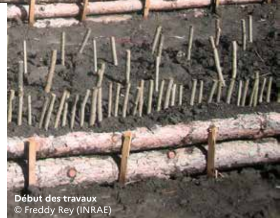
Début des travaux

La mise en œuvre de la compétence GEMAPI (Gestion des milieux aquatiques et prévention des inondations) appelle aujourd'hui à des solutions devant permettre d'accorder la prévention des inondations avec la gestion intégrée des milieux aquatiques. Des utilisations innovantes de ce type de solution ont été développées en particulier dans le bassin versant de la Durance, en vue d'augmenter la sécurité face au risque d'inondation, la résilience des écosystèmes et la préservation des biocénoses aquatiques.