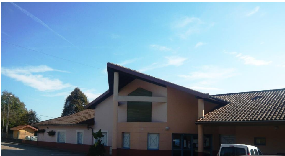
École primaire de Ruy Montceau

En parallèle, dans le cadre d'un projet européen (STEPPING, porté par AURA-EE), elle a accompagné des audits énergétiques et l'élaboration de projets de rénovation en contrats de performance énergétique (CPE) pour cinq écoles de cinq communes.