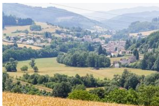
Commune de Lamure sur Azergues.

Contact : Sophie Moncorgé, Chef de projet « Territoire à énergie Positive » Beaujolais Vert 04 74 05 06 60 sophie.moncorgé@c-or.fr